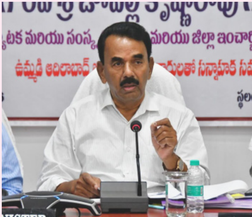
వ్యవస్థ పరిపుష్టమైందని తెలిపారు. జీవితం కష్టసుఖాల సమ్మేళనం, ఉగాది పచ్చడిలోని షడ్రుచుల మాదిరిగానే జీవితంలో ఎదురయ్యే కష్టసుఖాలను సమానంగా స్వీకరిస్తూ ముందుకు సాగాలన్నారు. శ్రీ పరాభవ నామ సంవత్సరంలో తెలంగాణతో పాటు, దేశం మరింత అభివృద్ధి సాధించాలి అని ఆకాంక్షించారు.

వ్యవసాయ సంవత్సరంగా పరిగణించే ఈ ఉగాది రైతులకు, ప్రజలకు అన్ని రంగాల్లో శుభాలను చేకూర్చాలి అని మంత్రి ఆకాంక్షించారు. సమ్మర్షిగా పంటలు పండి, ప్రజల జీవితాల్లో సుఖ సంతోషాలు వెల్లివిరియాలని అభిలాషించారు. ప్రకృతితో మమేకమై, వ్యవసాయ ఉత్పత్తి నందిండాల్లో పరస్పర సహకారం ప్రేమాభిమానాలతో పాల్గొనే సబ్బంది వర్షాలకు, ఉగాది గొప్ప పండుగ అన్నారు. ప్రజల శ్రామిక సాంస్కృతిక జీవనంలో ఆది పండుగగా ఉగాదికి ప్రత్యేక స్థానం ఉందన్నారు. రైతుల సంక్షేమానికి రాష్ట్ర ప్రభుత్వం చిత్తశుద్ధితో కృషి చేస్తోందని పేర్కొన్నారు. వ్యవసాయ రంగ అభివృద్ధితో అనుబంధ రంగాలు, వృత్తులు బలపడి రాష్ట్రంలో గ్రామీణ ఆర్థిక