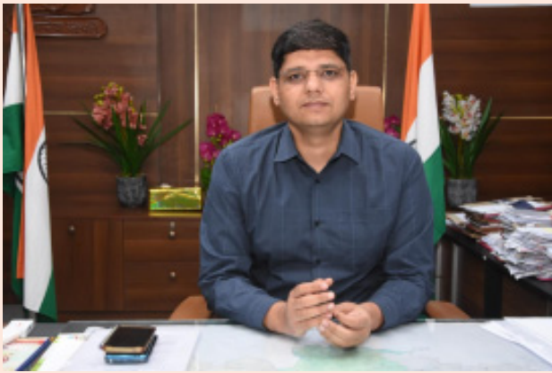
ఈ యుగాది వర్షదినం ప్రతి ఒక్కరి జీవితంలో కొత్త ఆశలు, అవకాశాలు, విజయాలను తీసుకురావాలని జిల్లా పాలనాధికారి ఆకాంక్షించారు.

యుగాది తెలుగు నూతన సంవత్సరానికి ఆరంభ సూచికగా నిలిచే వర్షదినమని, ఇది మన సంస్కృతి, సంప్రదాయాలను ప్రతిబింబించే విశిష్టమైన వేడుక అని ఆయన తెలిపారు. ఈ శుభ సందర్భంలో ప్రతి కుటుంబం సుఖసంతోషాలతో, ఐశ్వర్యంతో, ఆరోగ్యంతో నిండిపోవాలని ఆకాంక్షించారు.